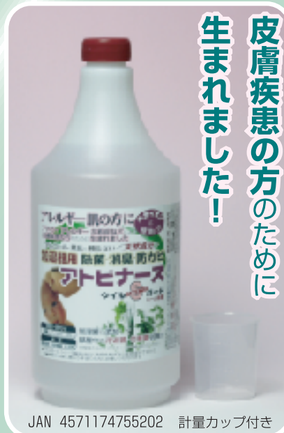
JAN 4571174755202 計量カップ付き