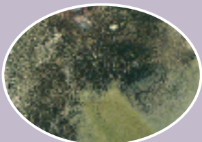
「ウイルス・ストロング・ガード」無し (カビが大量発生している)