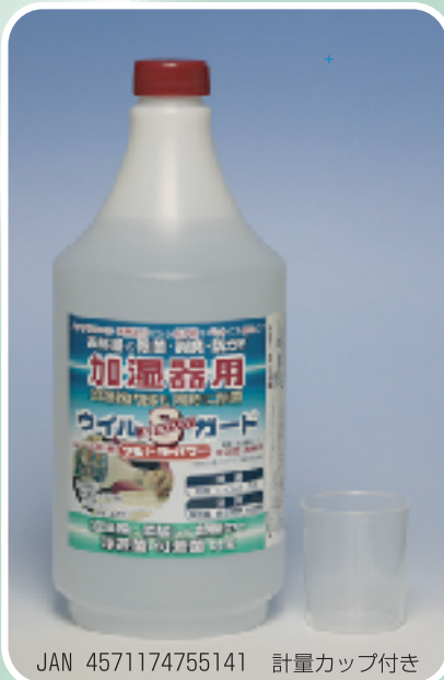
JAN 4571174755141 計量カップ付き