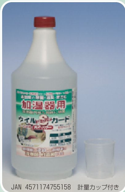
JAN 4571174755158 計量カップ付き